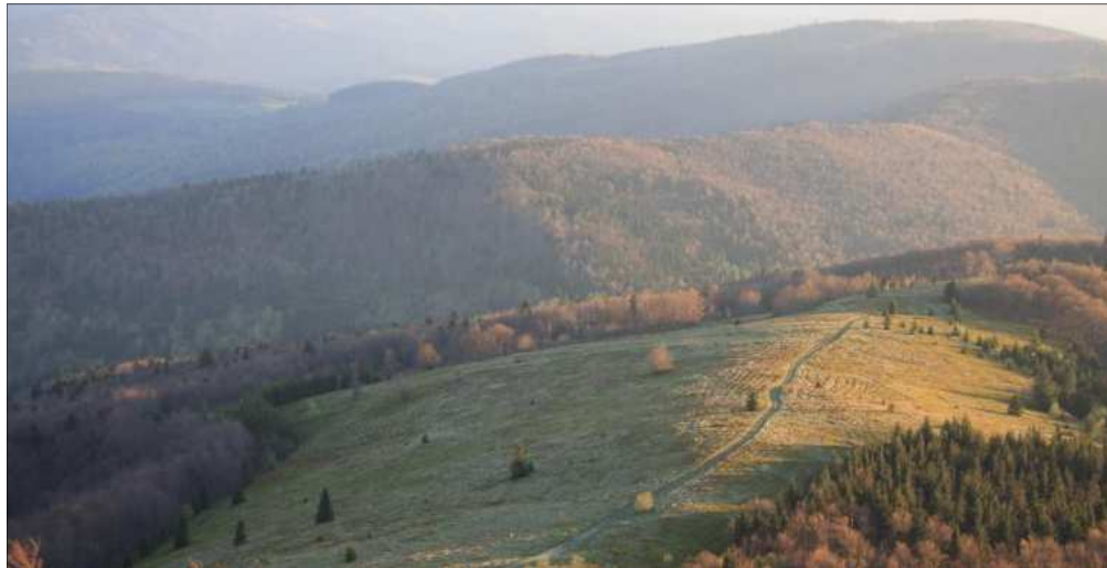
Będziemy wędrować po bardzo pięknych szlakach, a wciąż mało znanych