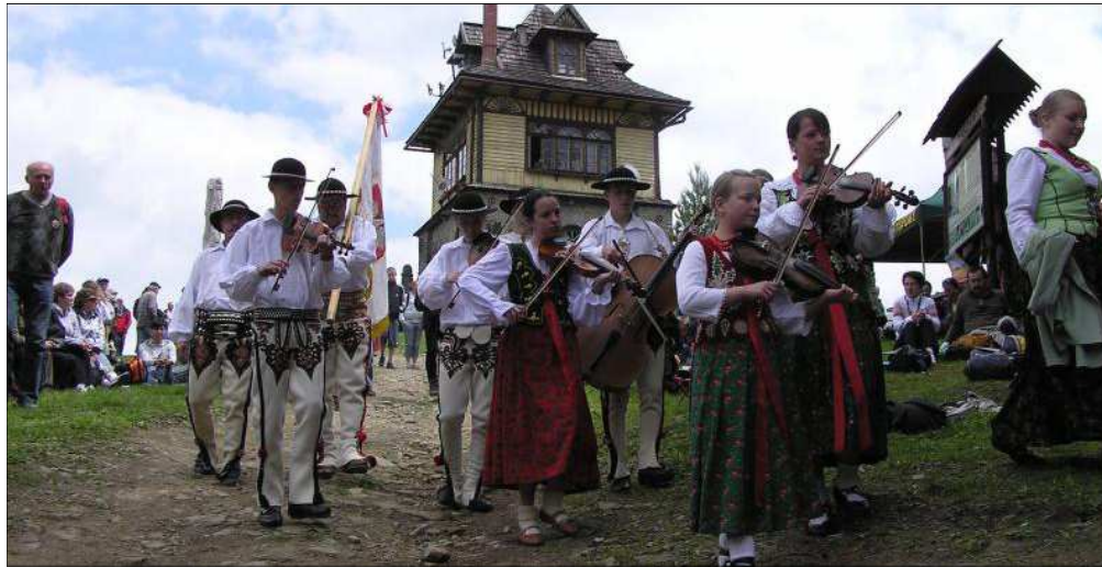
W tym roku na Luboń Wielki wybierzemy się 12 lipca

Aby go pokonać trzeba będzie przejść 320 km. Zdobycie ponad pięćdziesięciu kopiastych wierzchołków w 16 dni daje prawo do noszenia specjalnej złotej